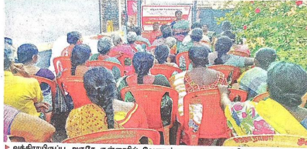
வத்திராயிருப்பு அருகே குன்னூரில் வேளாண்மை துறை சார்பில் மண்புழு உரம் தயாரித்தல் குறித்து விவசாயிகளுக்கு பயிற்சி வழங்கப்பட்டது.